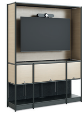
Media Tower 5 Fachhöhen (Halterung innen)