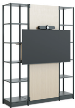
Media Tower 5 Fachhöhen (Halterung außen)