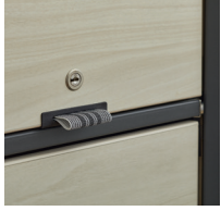
Tür mit Stoffgriff + Schloss