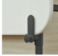
Mobile Board Clip