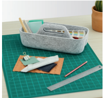
Ablageschale mit Innenorganisation