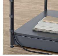
Clip fürs Kabelmanagement