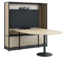
Media Tower mit Tisch 4 Fachhöhen (Halterung innen)