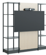
Media Tower 4 Fachhöhen (Halterung außen)