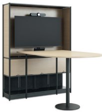
Media Tower mit Tisch 5 Fachhöhen (Halterung innen)