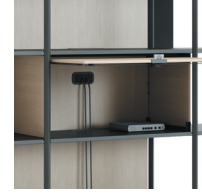
Media Tower Kabelmanagement