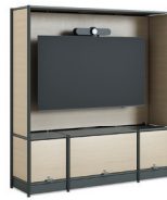
Media Tower 4 Fachhöhen (Halterung innen)