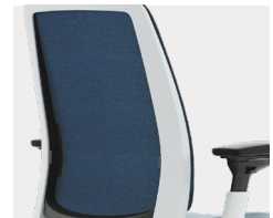
Rückenbezug aus Stoff